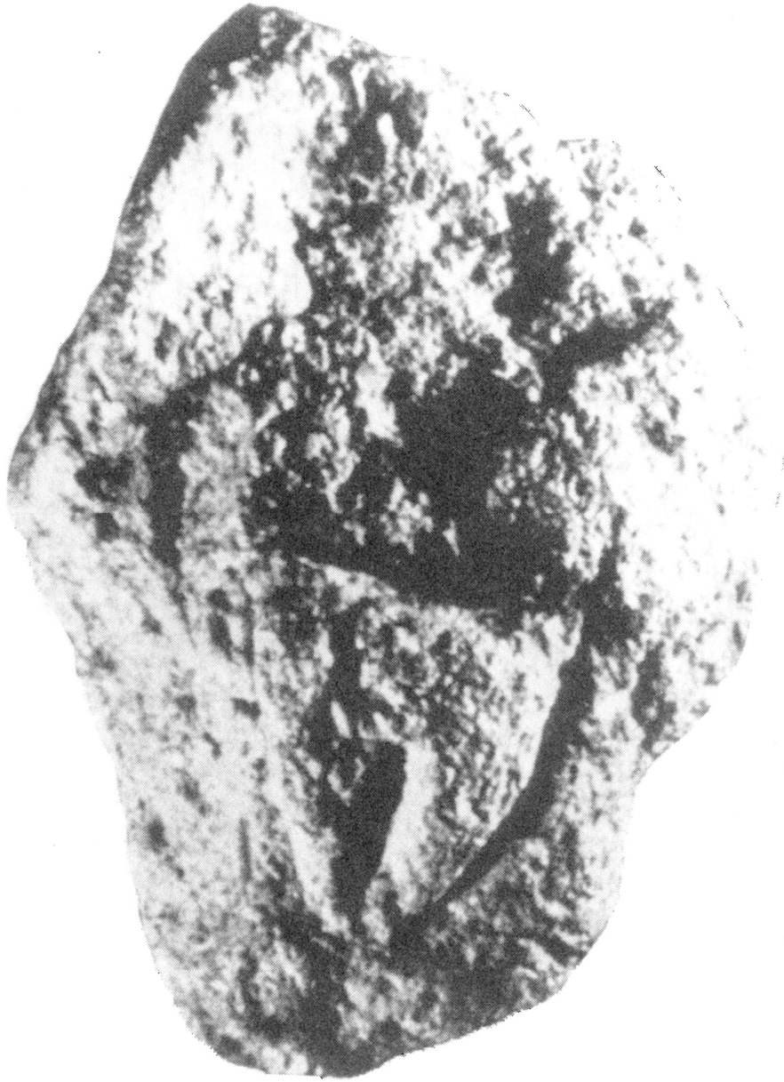
Bloc gravé d'une vulve. Aurignacien. La Ferrassie (Dordogne)

dance avec le temps, à se faire rares et vont pour les signes vulvaires se géométriser pour devenir des blasons. Nous pouvons en déduire que ces représentants sexuels sont autre chose que la naissance du réalisme graphique, ils indiquent plus qu'ils n'expriment. Nous nous trouvons donc en présence de signes abstraits et de représentants sexuels. Les représentations génitales ne semblant pas tellement disjointes des signes abstraits, car leur graphisme s'estompe très vite au profit d'une géométrisation symbolisée. Essayons maintenant avec A. Leroi-Gourhan d'en discuter leur portée.