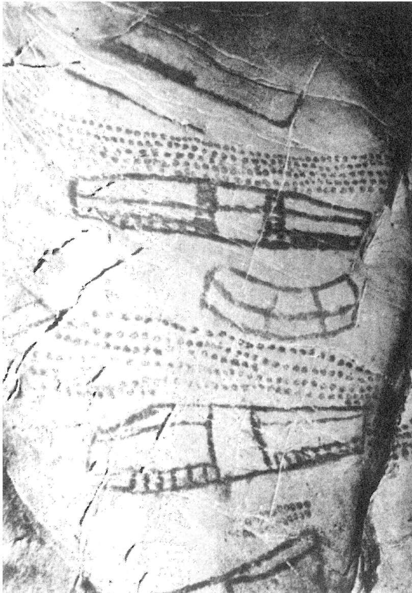
Signes ponctués et signes en blason Grotte d'El Castillo (Espagne cantabrique)

sur-Cure, datée de 32 000 ans avant J.-C., qui forment les plus anciennes inscriptions 7 .